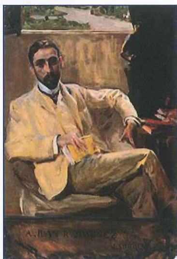
Retrato de Juan Ramón Jiménez, pintado por Joaquín Sorolla .

En 1891 aprueba con calificaciones de sobresaliente el examen de Primera Enseñanza en el Instituto "La Rábida" de Huelva. En 1893 estudia Bachillerato en el colegio de San Luis Gonzaga del Puerto de Santa María , y obtiene el título de Bachiller en Artes. Se traslada a Sevilla, en 1896, para ser pintor, creyendo que esa es su vocación. Allí frecuenta la biblioteca del Ateneo sevillano. Escribe sus primeros trabajos en prosa y verso. Empieza a colaborar en periódicos y revistas de Sevilla y Huelva .