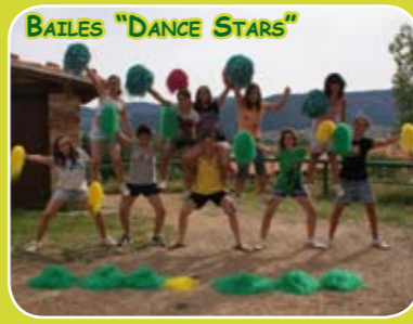
BAILLES "DANCE STARS"