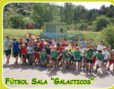
FÚTBOL SALA "GALACTICOS"