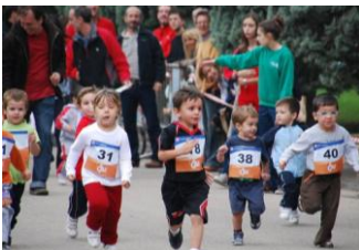
Grupo de niños 1º infantil

Como siempre, queremos agradecer su colaboración a los padres que, tanto con anterioridad como en el desarrollo de la carrera, participaron activamente en la organización ya que sin ellos la carrera no sería posible. Deseamos que en la próxima edición la participación sea por lo menos igual o a ser posible mayor.