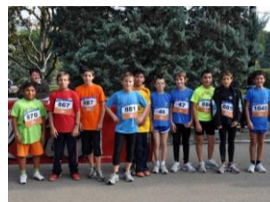
Grupo de niños 6º primaria

¡Enhorabuena a ganadores y participantes!