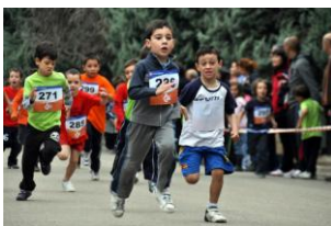
Grupo de niños 1º primaria