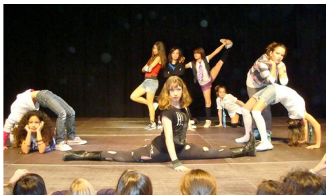
Grupo de Baile Moderno 5º y 6º