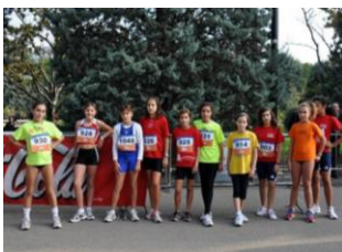
Grupo de niñas 6º primaria