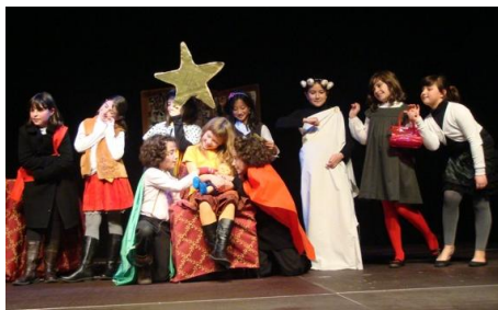
Grupo de Teatro

Los alumnos de la extraescolar de Manualidades realizaron el atrezzo de la obra de teatro. Como novedad, este año las exhibiciones del 13 de diciembre se presentaron en español y en alemán, gracias a la colaboración del grupo de alumnos de alemán de 6º de Primaria.