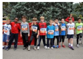
Grupo de niños 3º primaria