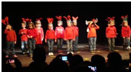
Música y Movimiento