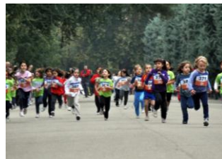
Grupo de niñas 1º primaria